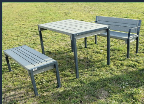
TABLE & BANC DE PIQUE-NIQUE